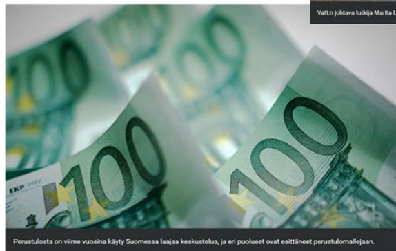
Perustulosta on viime vuosina käyty Suomessa laajaa keskustelua, ja eri puolueet ovat esittäneet perustulomallejaan.