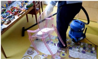
Kotitalousvähennystä käytetään esimerkiksi kodin siivoukseen.

Kotitalousvähennys voi pienentyä jo vuoden alussa. Päätös aikataulusta on määrä tehdä budjettiriihessä.